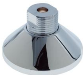
Art. 971984 Art. 971992 Art. 971994

Till alla väggmonterade blandare utom de som monteras dolt behövs blandarfästen. Dessa köps separat för att matcha utvald blandare och vald typ av rör i installationen. Här visas de blandarfästen vi säljer som kan kombineras med våra väggblandare. Här visas även en del alternativ för att överbrygga måttskillnaderna mellan 150 c/c och 160 c/c om ett befintligt blandarfäste ska användas.