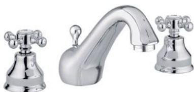
Tvättställsblandare 3-håls 912

Trehåls tvättställsblandare med matchande bottenventil.