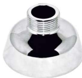
Art. 971583 Art. 971592 Art. 971594

Art. 971994 - Fäste med kromad kåpa för 16 mm PEX-slang