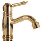
Obehandlad polerad mässing *åldras naturligt